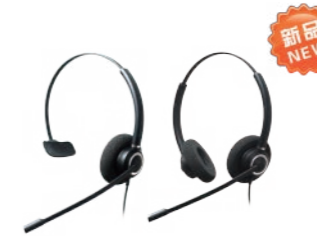
Crystal 2831 Crystal 2832