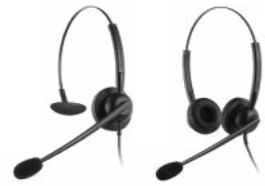
Crystal 2700 Crystal 270S