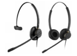
Crystal 2871 Crystal 2872