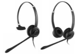
Crystal 2701 Crystal 2702