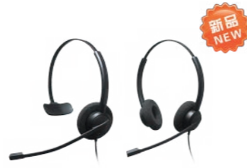
Crystal 2731 Crystal 2732