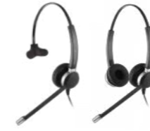
Crystal 2821 Crystal 2822